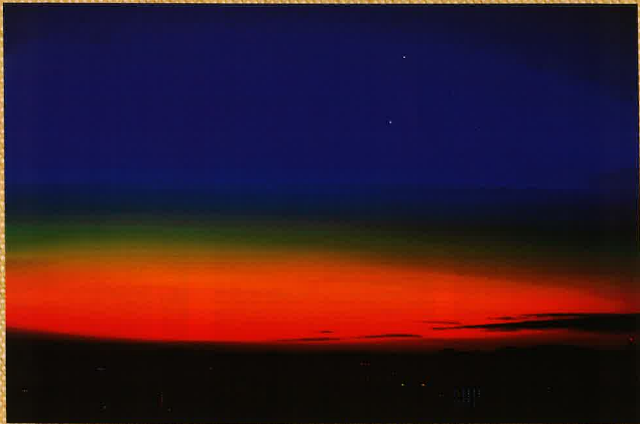
薄光:夜明け前の闇の中に、うっすら明るくなっていく光